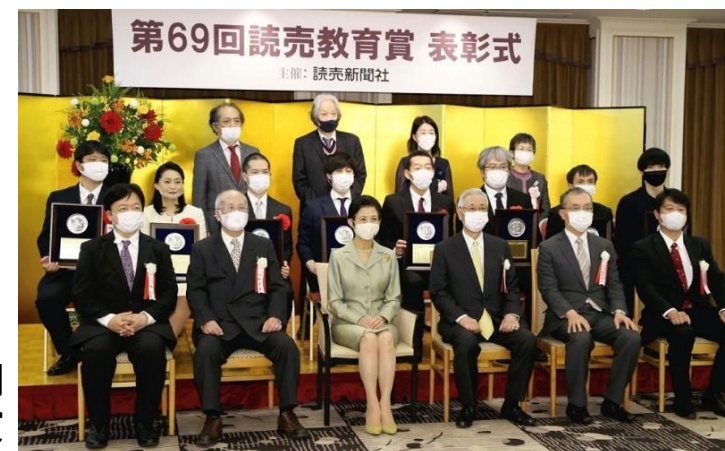
2020年 読売教育賞 カリキュラム・学校づくり部門 最優秀賞受賞