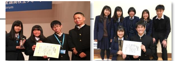
全国高校生フォーラム 2016年 2019年