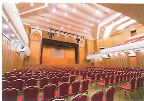
講堂 (定員 1,800 名)