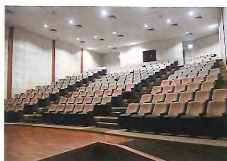
レクチャーシアター (数:3、定員 各216 名)