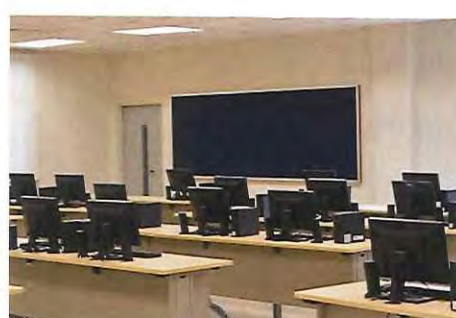
英語学習室 (数:5、定員 各30 名)