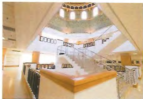
図書館 (定員 1,000 名)