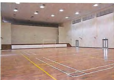
多目的ホール (数:2、定員各 350 名)