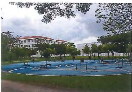
エコパーク & 屋外ジム