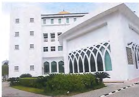
食堂 (定員 500 名)