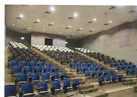
レクチャーシアター