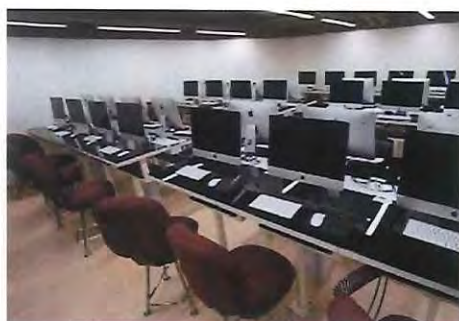
PCルーム (数:7、定員 各25 名)