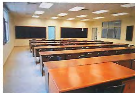
クラスルーム (数 44、定員 30 名/室)