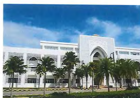
基礎教育センター