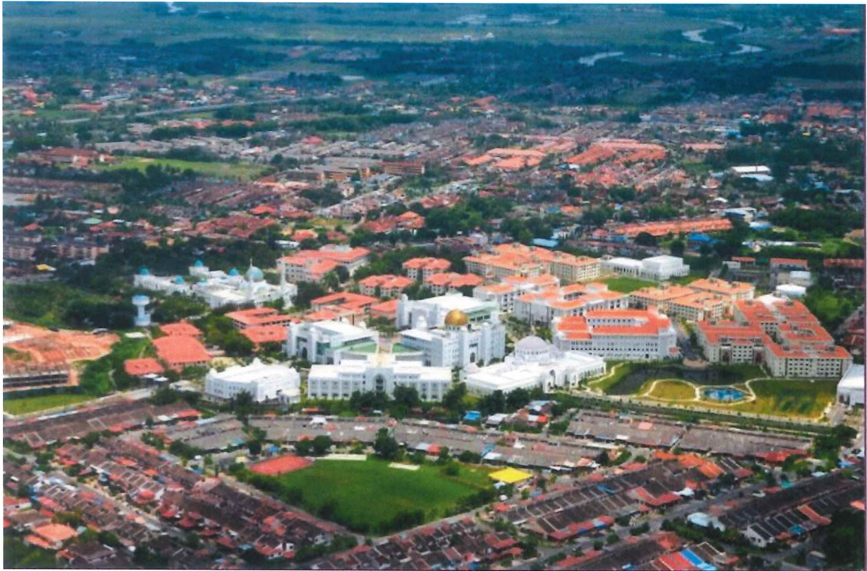
ALBUKHARY INTERNATIONAL UNIVERSITY